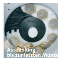
Auszahlung bis zur letzten Münze